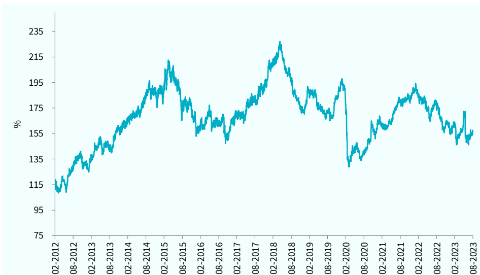
— TCM Africa High Dividend Equity